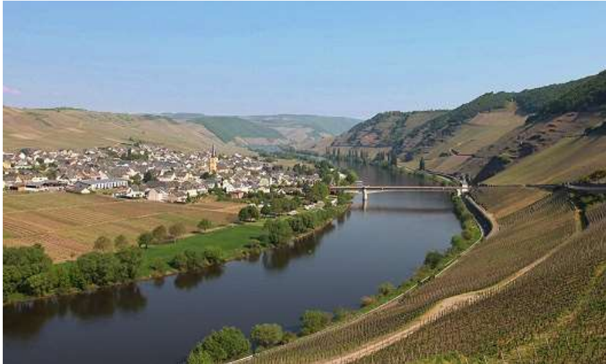
Trittenheim: Die Mosel im Frühling