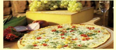
“Flammkuchen” - lekker ...!

Ook voor de inwendige mens wordt gezorgd: “Flammkuchen” en andere specialiteiten van de Moezel. Met een alcoholvrij drankje en een goede kop koffie kunt u besluiten.